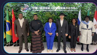
高级别国际领导人参访金砖AI中心展厅