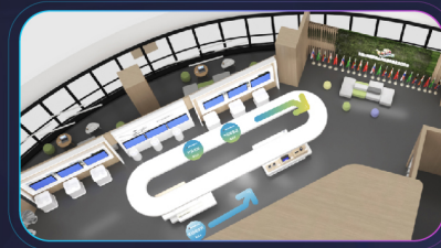
共赢金砖·智领未来”主题展厅示意图